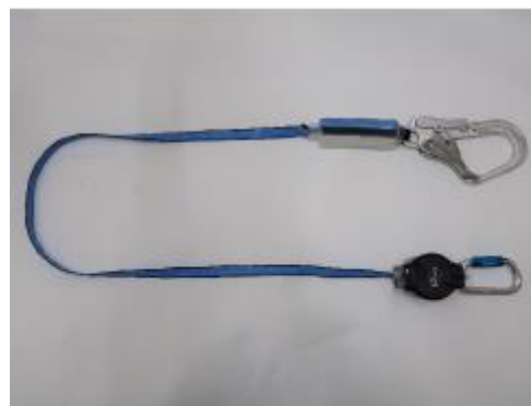
ランヤード全体 (巻取器からストラップを全て出した状態)