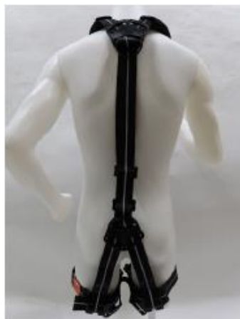
フルハーネス全体（後側）